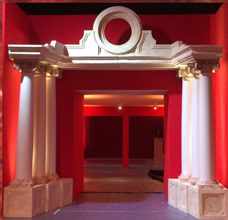
Le portique médaillon