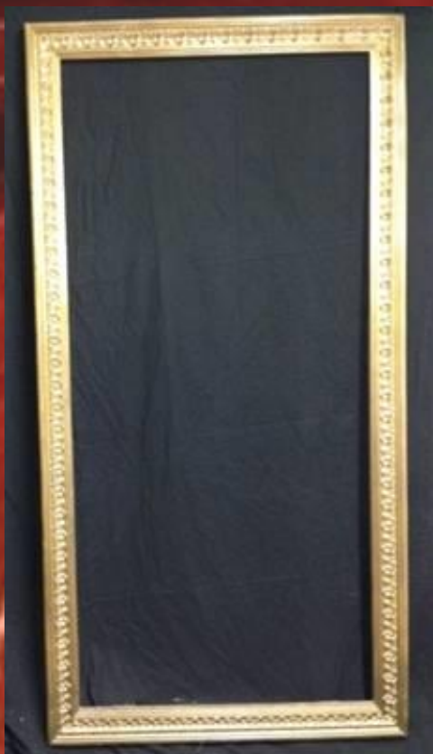
Cadre baroque 2m/1m or 6 pièces 60.-/pièce HT