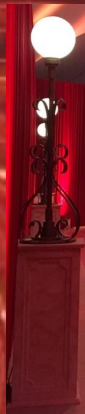
Lampe boule 2m50 8 pièces Effet marbre + fer forgé 150.-/pièce