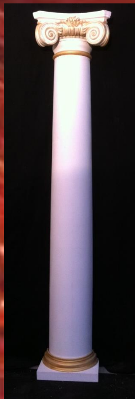
Colonnes 2m50 16 pièces blanc et or vieilli 80.-/pièce