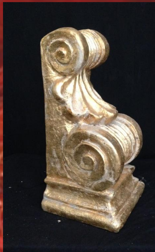
Moulure 30/60cm or 3 pièces 20.-/pièce HT