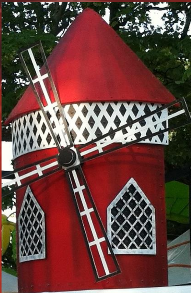
Le Moulin Rouge