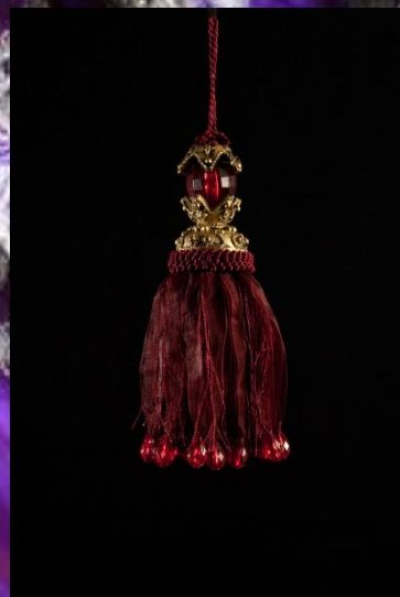
Pompon 5 pièces 5.-