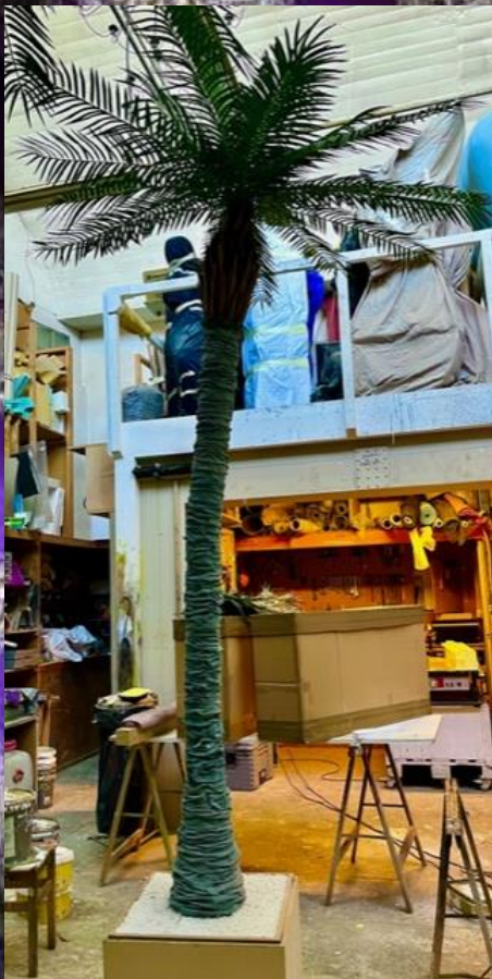
Palmier Hauteur : 2 à 3,50m Coloris : Naturel Nombre : 4 Prix : 80.-/pièce