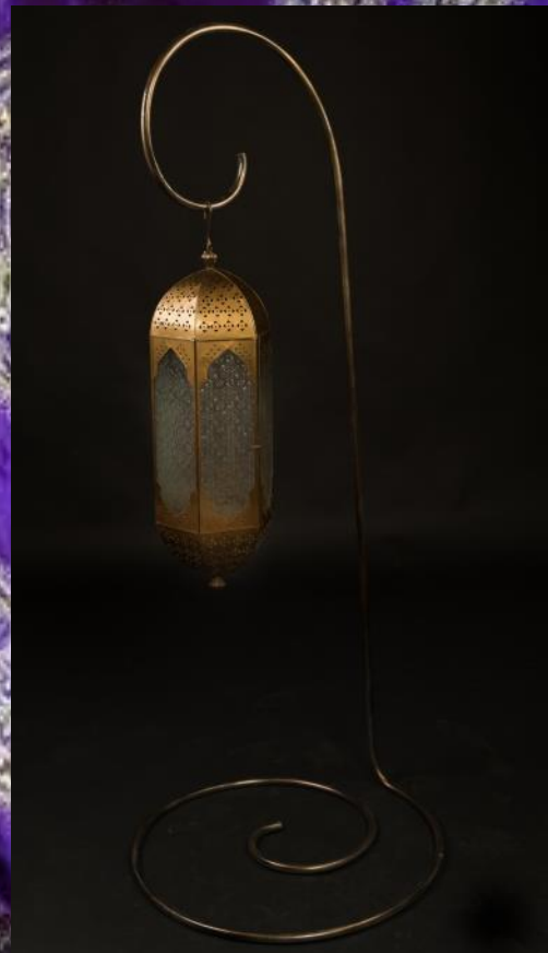
Support lampe (sans lampe) Hauteur 150cm 12 pièces 15.-