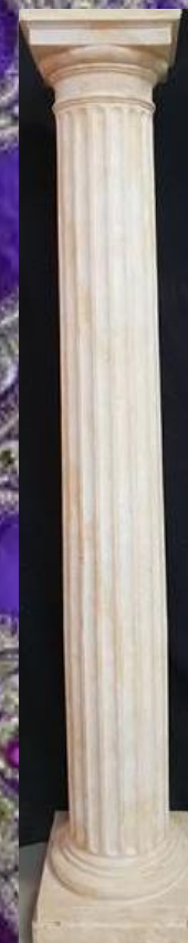
Colonnes 2m 6 pièces Blanc 60.-/pièce