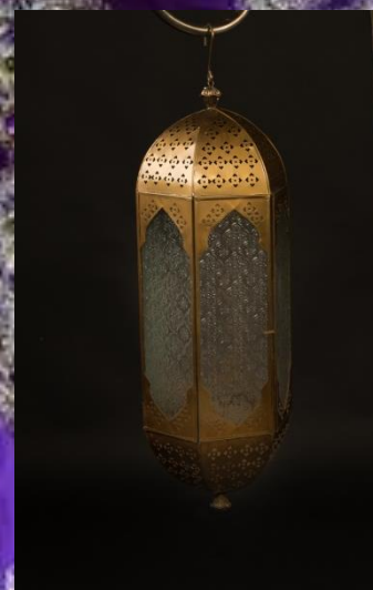
Lampe allongée cuivre Hauteur 55cm 4 pièces 25.-