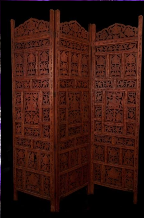
Paravent Hauteur 2m 1 pièce 60.-