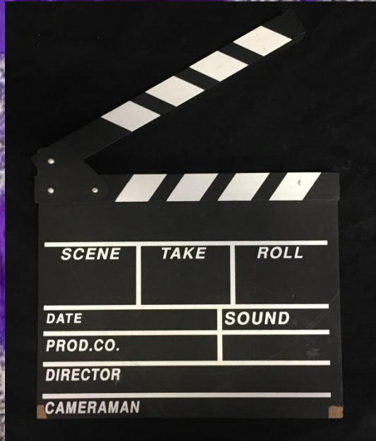
Clap de Cinéma Noir et blanc H28cm/L30cm 59 pièces 10.-/pièce HT