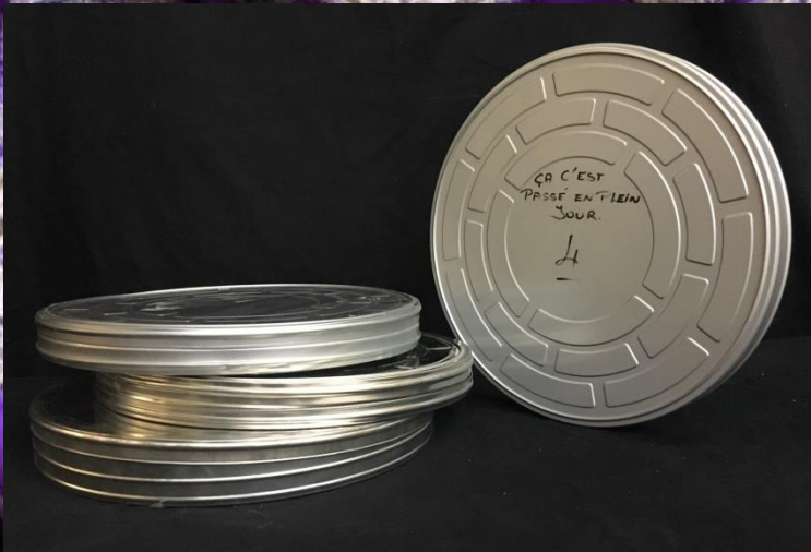
Boîte de Bobine de film argent Ø 40cm H4cm 63 pièces 10.-/pièce HT