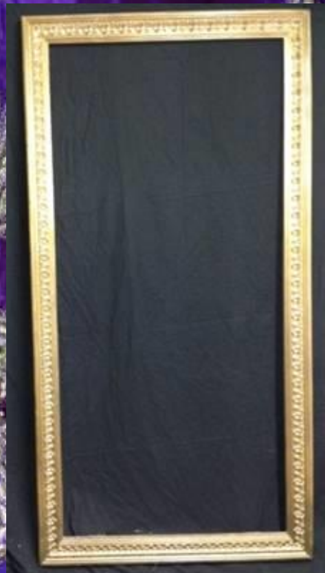
Cadre baroque 2m/1m or 6 pièces 60.-/pièce HT