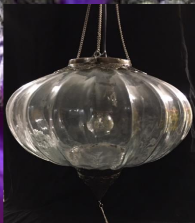
Lampe ronde verre Ø 30 cm 3 pièces 30.-