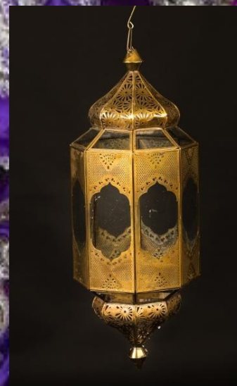
Lampe allongée cuivre Hauteur 58cm 4 pièces 25.-