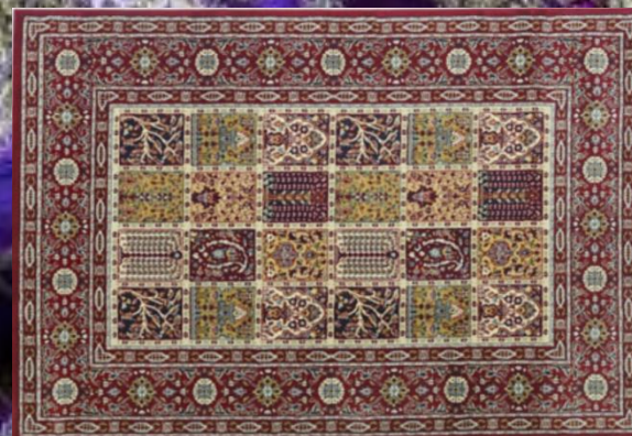
Tapis Oriental 1m96x1m35 6 pièces