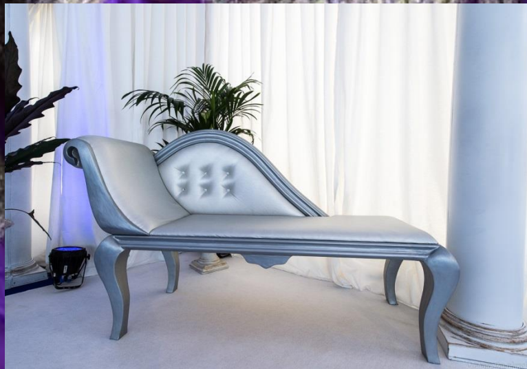
Liseuse Légèrement argentée 2m de long 1 pièce 120.-/pièce HT