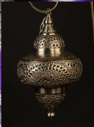
Lampe ronde Hauteur 35cm 4 pièces 40.-