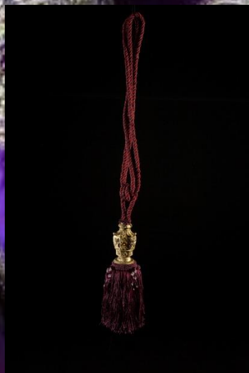
Embrasses 20 pièces 10.-