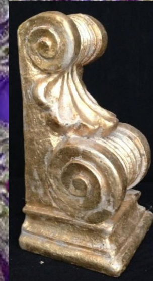
Moulure 30/60cm or 3 pièces 20.-/pièce HT