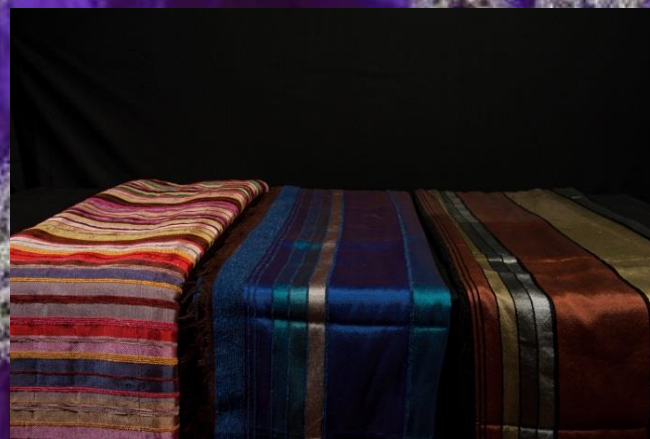
Tissus 3 pièces 30.-